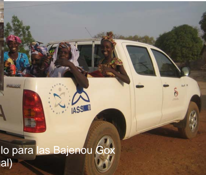
Dotación vehículo para las Bajenou Gox (Sedhiou.Senegal)