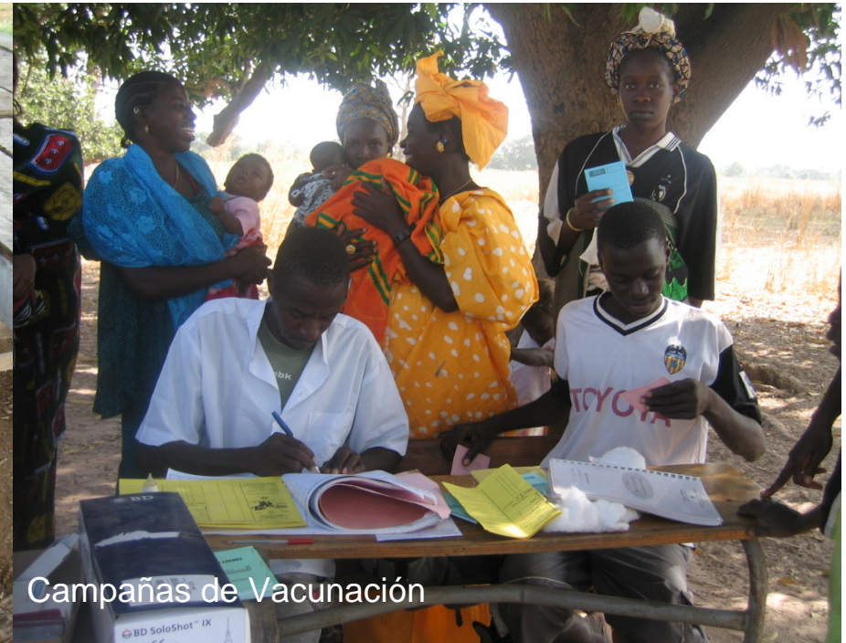
Campañas de Vacunación