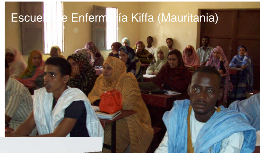
Escuela de Enfermería Kiffa (Mauritania)

Mejora de la calidad de la formación de base y aumento del nº de enfermeras formadas