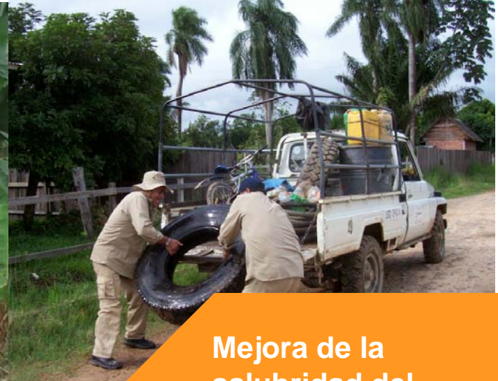
Mejora de la salubridad del entorno