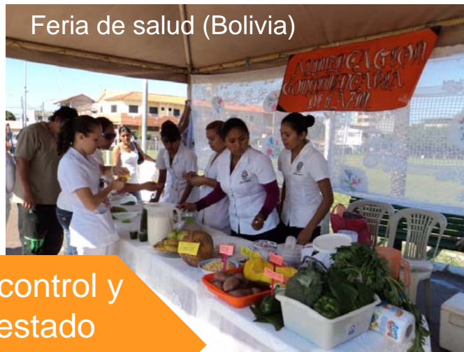
Feria de salud (Bolivia)

Nutrición :control y mejora del estado nutricional de la población