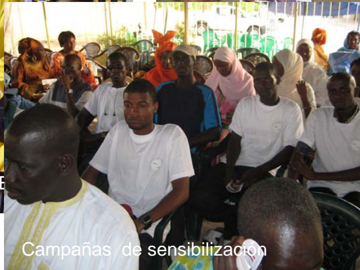
Campañas de sensibilización