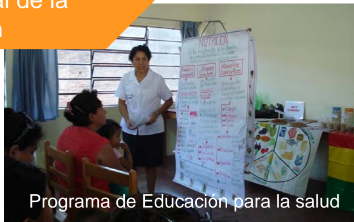
Programa de Educación para la salud