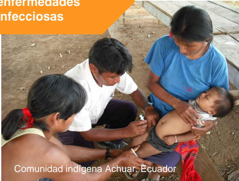
Comunidad indígena Achuar. Ecuador