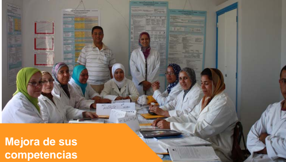
Enfermeras formándose en salud materno-infantil (Salé- Marruecos)