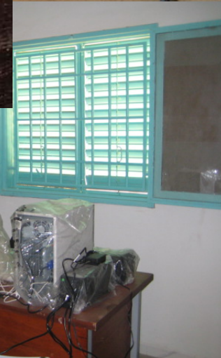
Puesto de salud de Sessene, (Senegal)