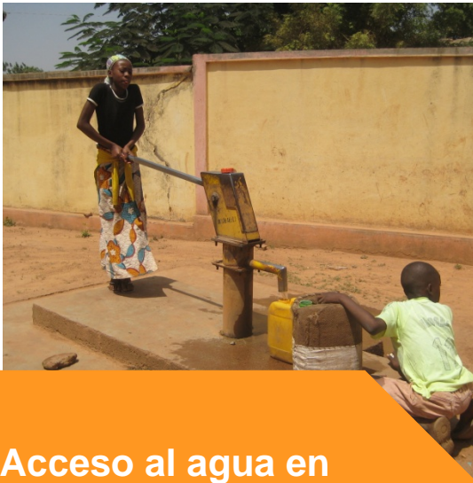
Acceso al agua en poblaciones rurales

Prioridades sectoriales: Agua y saneamiento básico