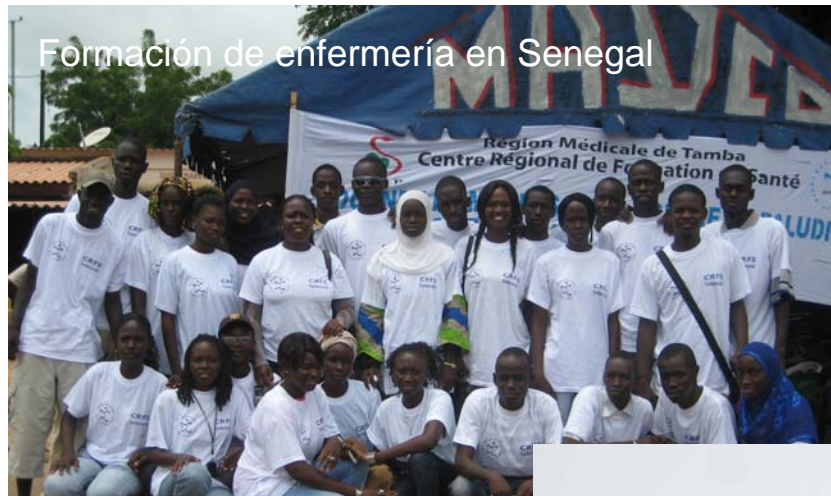
Formación de enfermería en Senegal

Prioridades sectoriales: Refuerzo de la profesión enfermera