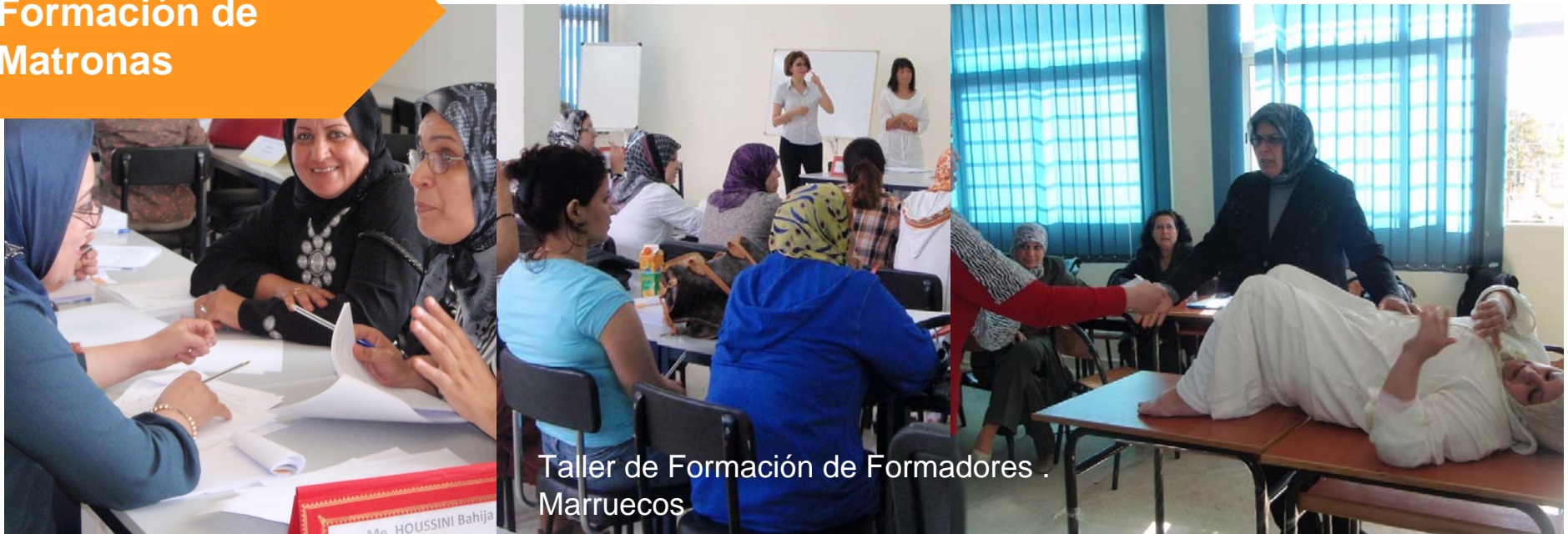
Taller de Formación de Formadores . Marruecos