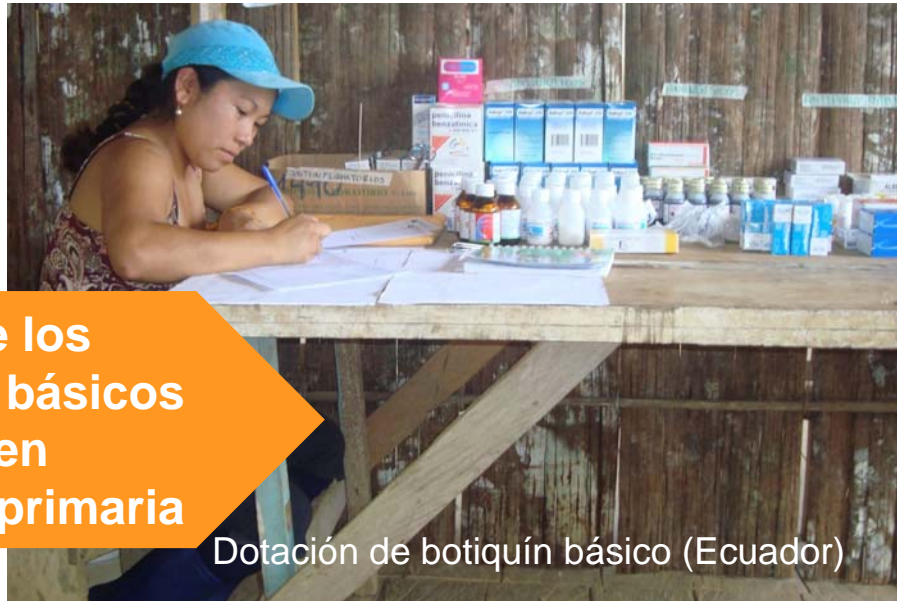
Dotación de botiquín básico (Ecuador)

Mejora de los servicios básicos de salud en atención primaria