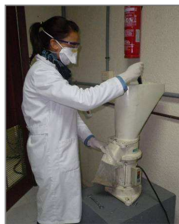
Figura 6. Triturado de residuos avícolas

En este sentido, el Proyecto PODEBA demostrará la viabilidad de una técnica de tratamiento y acondicionamiento de residuos avícolas, y su utilización como materia prima en la etapa de rendido enzimático. Así, está previsto demostrar que con esta nueva técnica es posible fabricar pieles de calidad adecuadas para la fabricación de calzado y confección. Además, este proyecto demostrará las ventajas ambientales derivadas del uso de los residuos avícolas pues, se evitan los problemas derivados de la gestión y eliminación de estos residuos al reciclarse y usarse en el proceso de curtición, y se reduce la carga ambiental de las tenerías al utilizar productos naturales en lugar de productos químicos (menor consumo de productos químicos, energía y agua).