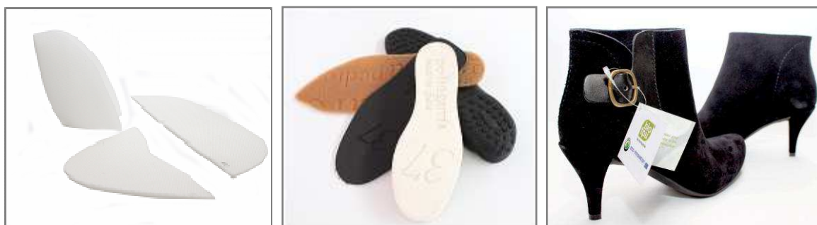
Figura 4. Materiales de refuerzo, suelas y calzado fabricados con TPU proveniente de fuentes renovables

Este novedoso material, así como los productos elaborados durante el proyecto, han sido sometidos a rigurosos controles de calidad que han verificado su idoneidad para su uso en calzado, presentando unas propiedades análogas a las de los TPUs convencionales, e incluso mejores en algunos casos.