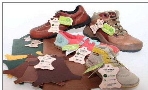
Figura 3. Zapatos fabricados con pieles curtidas con titanio

Asimismo, durante la ejecución del Proyecto TiLEATHER se realizaron continuos controles sobre las pieles y los zapatos fabricados con ellas (ver Figura 3), verificando sus propiedades, la idoneidad de su uso en calzado, así como el cumplimiento con los criterios ecológicos exigidos para la piel en la Ecoetiqueta Europea para Calzado.