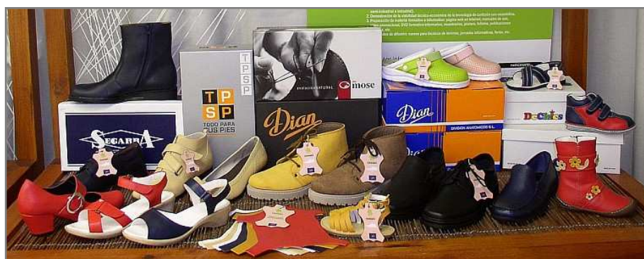
Figura 1. Zapatos fabricados con pieles curtidas con oxazolidina

En este contexto, el Proyecto OXATAN “Piel respetuosa con el medio ambiente curtida con oxazolidina” ha demostrado y promocionado una innovadora técnica de curtición utilizando un compuesto orgánico, la oxazolidina, como alternativa a la tradicional curtición con cromo. Durante la ejecución de este proyecto se elaboraron pieles curtidas con oxazolidina que sirvieron como materia prima para la fabricación de calzado (Figura 1) y productos de tapicería.