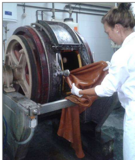
Figura 5. Engrase de pieles curtidas

El proceso de engrase incorpora materias grasas que aportan al cuero un tacto más suave y flexible. Esta etapa es necesaria porque en las etapas previas, sobre todo en la curtición, se deshidrata el cuero dejándolo duro y sin flexibilidad. Para el engrase del cuero pueden utilizarse diversas sustancias grasas pero, sobre todo, se usan cloroparafinas debido a su adecuada penetración y fijación al cuero. Las cloroparafinas son productos petroquímicos que pueden resultar perjudiciales para el medio ambiente debido, sobretodo, a su alta concentración de cloro y a su muy baja biodegradabilidad. De este modo el Proyecto ECOFATTING demostrará que, mediante la utilización de productos naturales de engrase, es posible conseguir pieles de calidad adecuadas para la fabricación de calzado y artículos de piel, al tiempo que promocionará la utilización de productos de engrase más respetuosos con el medio ambiente.