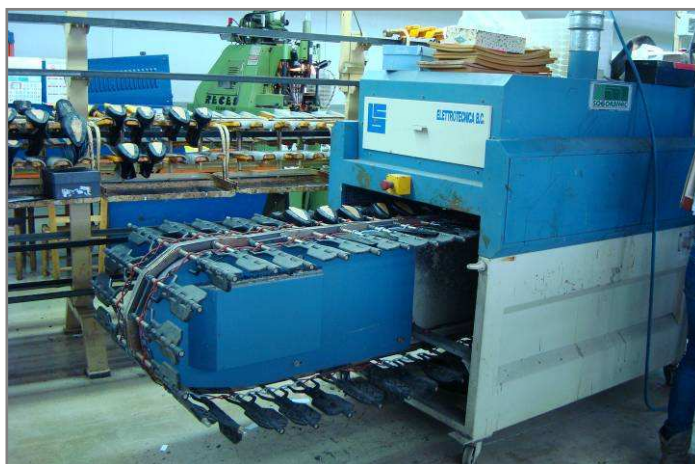
Figura 8. Horno de calor y secado de una empresa de calzado

Para lograr alcanzar estos objetivos, el proyecto IND-ECO prevé la realización de auditorías energéticas en empresas de calzado y curtidos de seis países europeos (España, Italia, Rumania, Bulgaria, Portugal y Reino Unido), y así obtener la información necesaria para estudiar las posibles soluciones energéticas que pueden ser introducidas en estos sectores industriales, de cara a reducir su consumo energético y las emisiones de CO 2 asociadas.