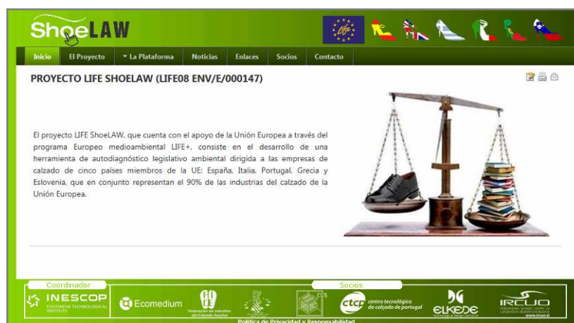
Figura 7. Página web de la plataforma ambiental del Proyecto SHOELAW: http://www.shoelaw.com

Esta herramienta, disponible en la dirección web http://www.shoelaw.com (ver Figura 7), ha sido probada con éxito en empresas de calzado de cinco Estados Miembros (España, Italia, Portugal, Grecia y Eslovenia), y ha permitido aumentar el grado de conocimiento de la legislación ambiental que afecta a las empresas de calzado, así como mejorar su situación ambiental, lo que pone de manifiesto la importancia de esta plataforma como instrumento para la mejora ambiental de las empresas de calzado.