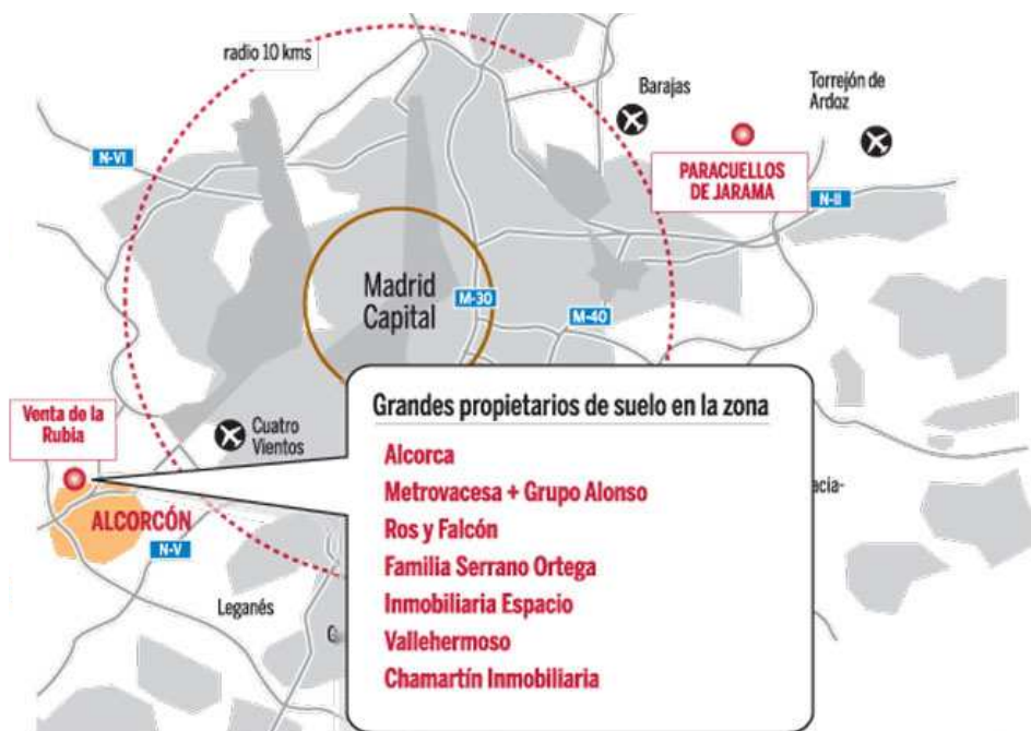
Ilustración 4. Relación de propietarios del suelo en los terrenos candidatos a albergar Eurovegas en Alcorcón (Madrid).

Los terrenos solicitados por Sheldon Adelson tienen una larga historia desde el primer proyecto que pretendió establecerse en ellos en 1999 (Parque del Milenio), aún sin revisar el Plan General, que ese mismo año se aprobaría y finalmente, tras múltiples modificaciones, lograría incorporar el sector norte como suelo urbanizable, en forma de macroproyecto residencial cohabitando con el compromiso previo adquirido con el club Atlético de Madrid que situaba allí mismo su ciudad deportiva (120 hectáreas). Estas vicisitudes han puesto en el tablero de juego en tantas ocasiones el remate norte de Alcorcón que su destino ha quedado ligado a infinidad de compromisos y propietarios que en un momento u otro adquirieron una parte de la actualmente ansiada localización. Esta deriva ha hecho que hoy día el suelo conocido popularmente como “La Venta de la Rubia” se reparta entre, el Ayuntamiento de Alcorcón, el Atlético de Madrid y al menos seis grandes empresarios y una treintena de pequeños propietarios.