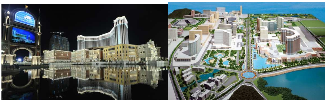
Ilustración 1. Ejemplos de construcciones en Las Vegas 7 Nevada (izqda) y Las Vegas Macao 8 (dcha)

Estableciendo una comparativa de nuevo con el complejo de Las Vegas Sands en Macao, cuya edificabilidad es, según nuestros cálculos, de 2'0 m 2 construidos por cada m 2 de suelo ocupado (2'0 m 2 s/ m 2 c), el proyecto europeo necesitaría como mínimo 3.000.000 m 2 de suelo, o lo que es lo mismo, 300 hectáreas, para poder llevar a cabo los 6.000.000 m 2 c necesarios. Para hacernos una idea de qué tipo de rascacielos estamos hablando, tan sólo indicar que la edificabilidad de las Torres de la antigua Ciudad Deportiva del Real Madrid 6 se aproxima a 1'70 m 2 s/ m 2 c. Es decir, que los hoteles propuestos para Eurovegas serían más altos que las torres más altas con las que cuenta la Comunidad Autónoma de Madrid.