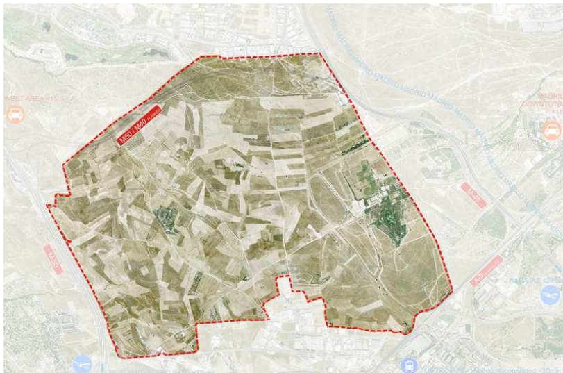
Ilustración 3. Ortofoto de los terrenos propuestos en Alcorcón (Madrid). Fuente: Libertad digital

Ilustración 2. Ortofoto de los terrenos propuestos en Valdecarros (Madrid). Fuente: Libertad digital