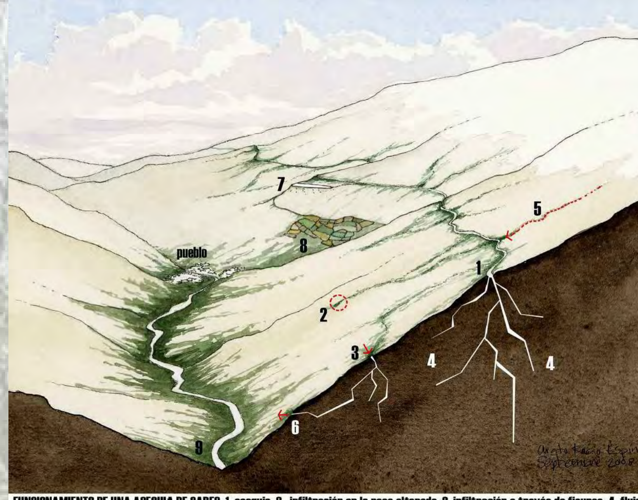
FUNCIONAMIENTO DE UNA ACEQUIA DE CAREO: 1. acequia; 2. infiltración en la roca alterada; 3. infiltración a través de fisuras; 4. flujo subterráneo profundo; 5. surgencias (manantiales); 6. fuentes; 7. balsas; 8. regadíos; 9. río