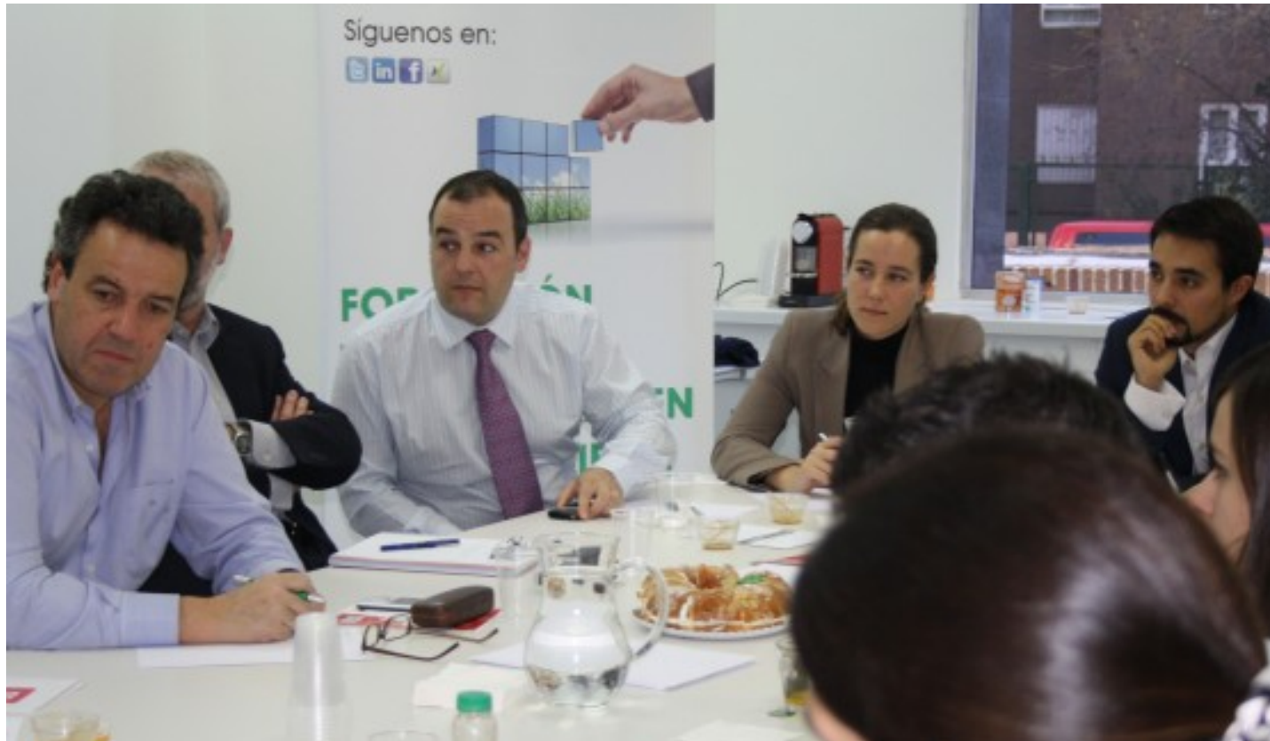
Desayunos de Trabajo para Emprendedores del Sector Ambiental